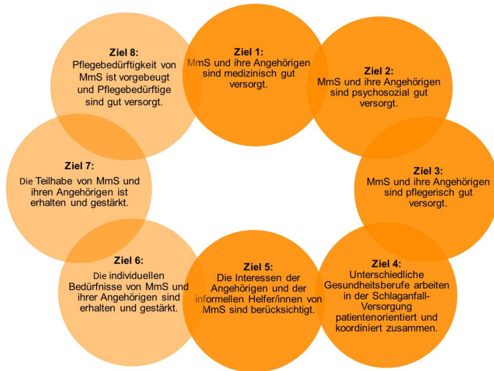
Abbildung 3 Gesundheitsziele für Menschen mit Schlaganfall in Berlin Pankow

Die GPK-S hat in Pankow fünf Gesundheitsziele zur Versorgung von Schlaganfallbetroffenen bestimmt. Diese können in Abbildung 3 Gesundheitsziele für Menschen mit Schlaganfall in Berlin Pankow eingesehen werden.