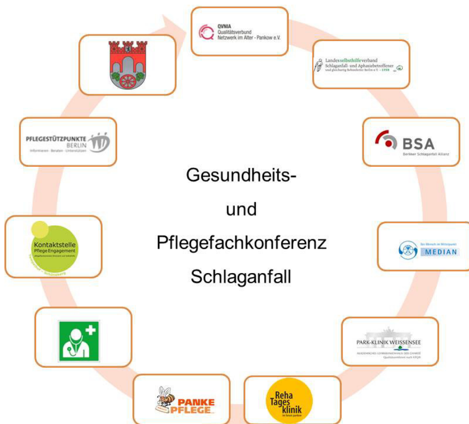
Abbildung 2 Zusammensetzung der GPK-S

Die GPK-S ist ein regionales Fachgremium von professionellen Akteuren und Vertretern der Selbsthilfe im Bereich der Schlaganfallversorgung. In Abbildung 2 wird ersichtlich, welche Akteure in dem Gremium involviert sind.